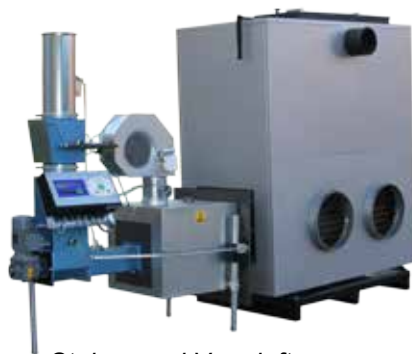
Stoker med Varmluftspanna